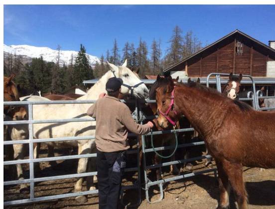
Neues Zuhause in San Jon