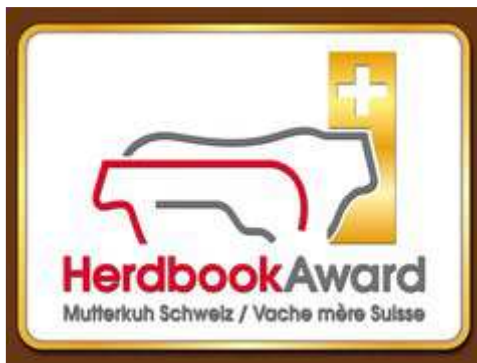
Herdbook Award für Guliver

Für seine züchterischen Qualitäten und für seine Langlebigkeit hat er im 2013 den silbernen und im 2016 den goldenen Herdbook Award von Mutterkuh Schweiz erhalten, worauf wir natürlich sehr stolz sind.