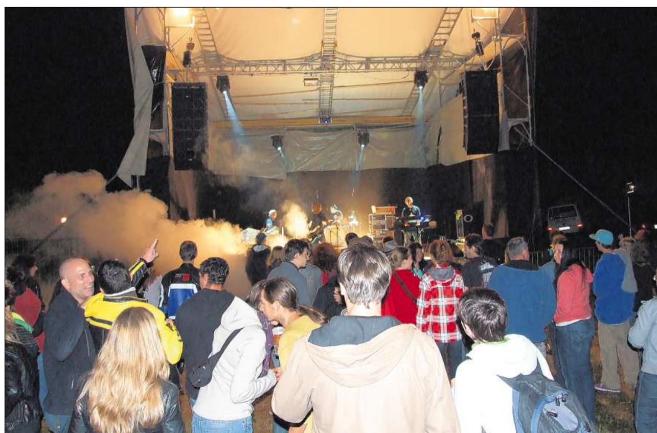
L'atmosfera da l'Open Air a l'En es unica.

■ La fin d'eivna dals 8 fin als 10 avuost es regnada in Engiadina da concerts suot tshèl avert. A Chapella ha lö il plü vegl open air dal Grischun, il Open Air Chapella. A Scuol/Pradella invezza pisseraran differentas gruppas in occasiun da l'Open Air a l'En per emoziuns. L'Open Air da Chapella es cuntschaint per si'indipendenza e per l'atmosfera familiara chi regna sülla piazza da festa. El düra adüna da venderdi saira fin dumengia davomezdi. Cha per festivals dad open air pitschens exista adüna ün tshert privel chi gijjan as perder illa fuolla dals festivals gronds, vegna dit. Causa cha quel da Chapella es però il plü vegl chi exista in Grischun ed as preschainta in ün möd special riva'l tenor ils organisatuors da l'evenimaint eir adüna darcheu da's profilare e da restar ün'attraziun speciala. In venderdi a las 19.00 cumainza l'Open Air Chapella cul concert da «Casper Nicca». A seis concert seguan quels da «Mo Blanc» e «Zibbz». In sonda a partir da las 13.30 concerteschan las bands: «Mountain Blues Generation», «Insomnia Rain», «Loom», «Keith Thompson», «Anna Kaenzig» e «Fabian Anderhub». In dumengia concerteschan a partir da las 11.00 «Leonti» e la «Famiglia Rossi».